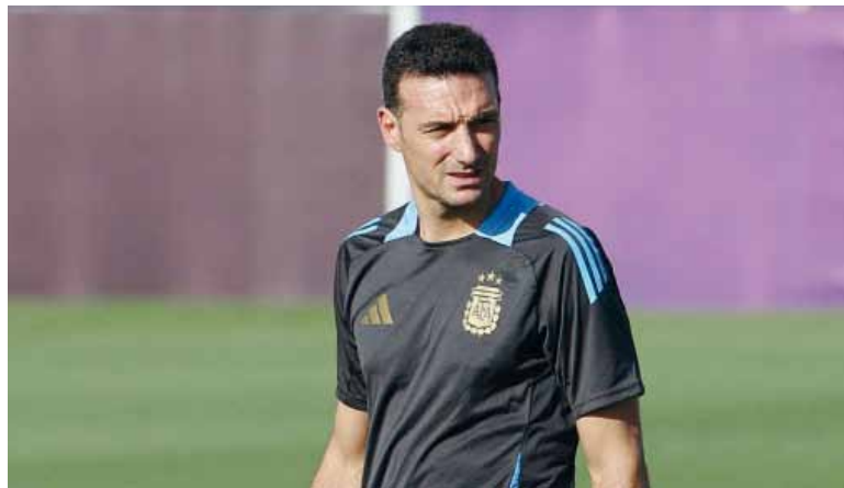
Aire nuevo. Al técnico argentino le gusta cada tanto renovar jugadores.

Las incorporaciones se dan en reemplazo de jugadores que habían estado en la anterior convocatoria contra Chile y Colombia: Valentín Castellanos (Lazio), Valentín Barco (Racing de Estrasburgo), Nicolás Domínguez (Nottingham Forest) y Enzo Fernández (Chelsea). Este último fue expulsado frente a los cafeteros y recibió dos fechas de suspensión.