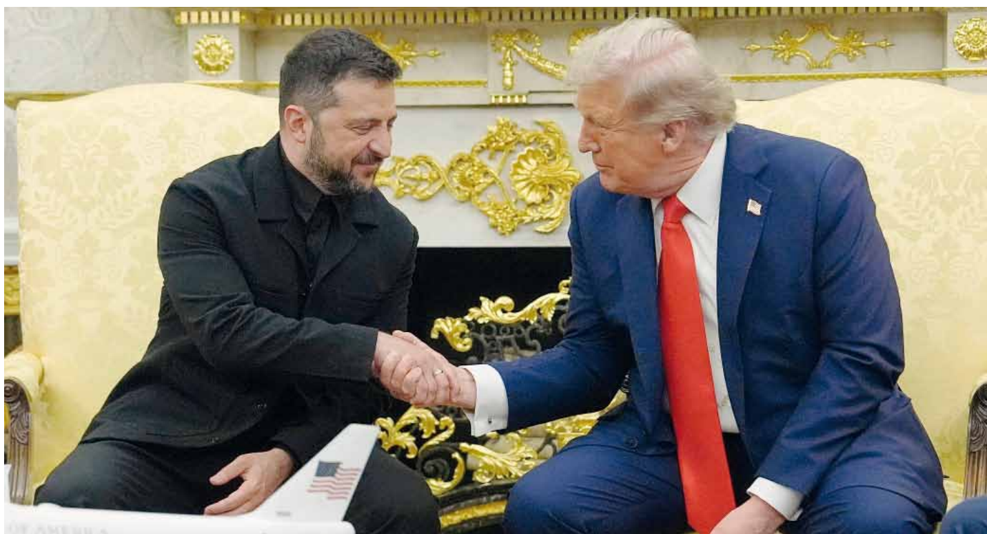
El presidente de EE.UU. y su par de Ucrania dialogaron primero a solas en la Casa Blanca y luego con el resto de los líderes europeos.

obra pública detenida está tomando una dimensión crítica", aseguró el mandatario. Agregó que "el estado de abandono está generando accidentes, pérdidas para el erario público y deterioro en el bienestar de los bonaerenses". Página 3