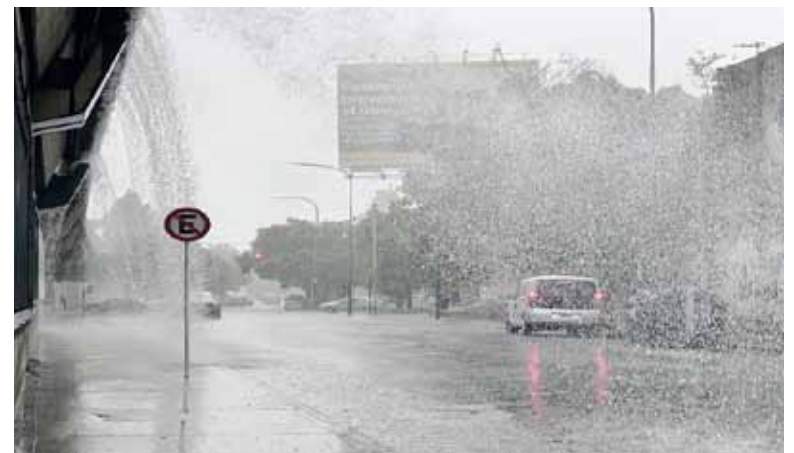
Inestable. Se esperan ráfagas de viento y fuertes lluvias en casi toda la provincia de Buenos Aires.

Las acumulaciones de lluvia podrían alcanzar entre 50 y 70 mm en menos de 24 horas, lo que equivale a casi el promedio mensual de precipitaciones de agosto.