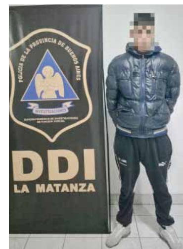
Entregados. Los menores fueron llevados por sus madres y uno de ellos sería el autor material del asesinato.