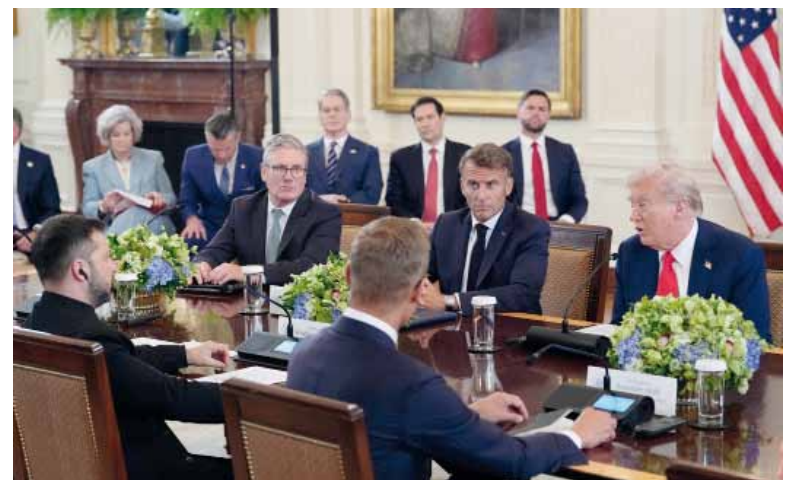
Respaldo. Los líderes de Europa concurren a Washington para apoyar a Zelenski.

El diario The New York Times remarcó que las conversaciones se han prolongado más de lo esperado y que todos los líderes han optado por cenar en la mansión presidencial estadounidense.