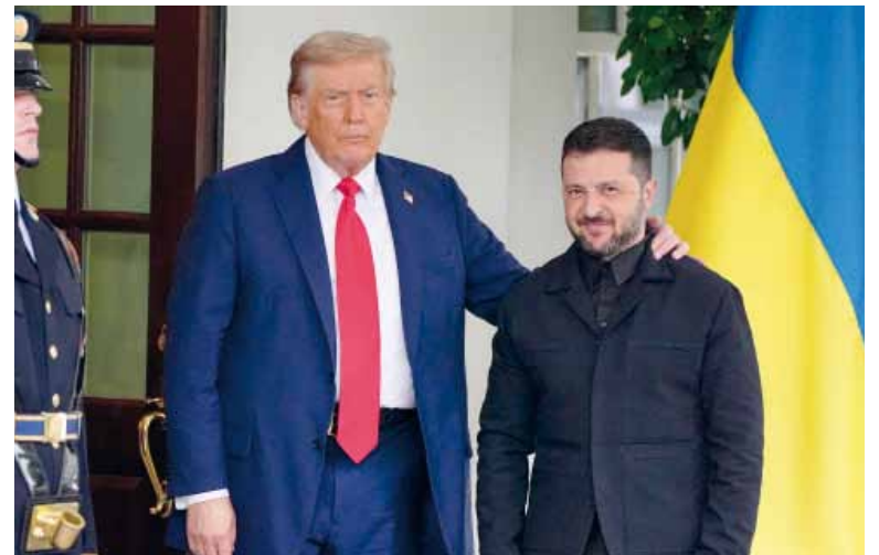
A solas. El presidente de Estados Unidos y su par de Ucrania mantuvieron primero un encuentro sin el resto de los líderes europeos.

Al inicio del encuentro multilateral Trump insistió a su vez en que era necesario debatir el "in-