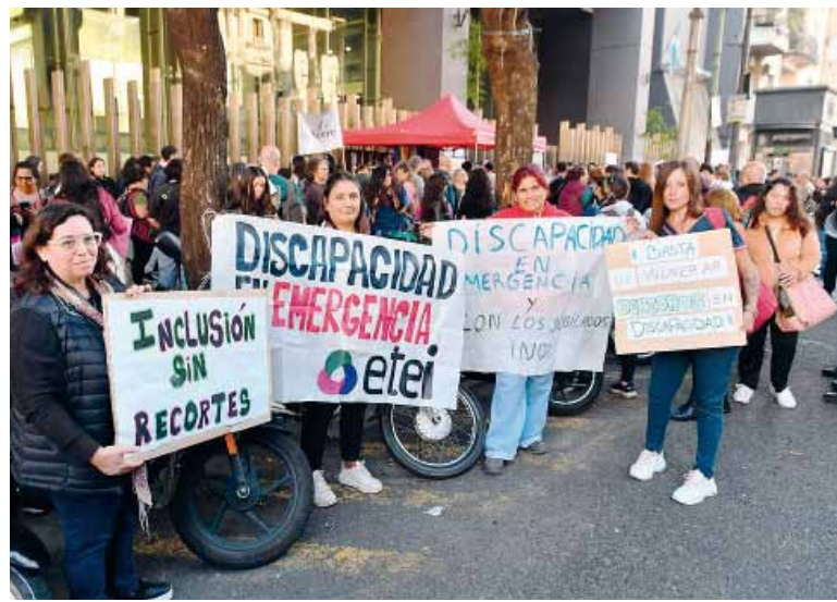
El fallo. "El derecho de los niños con discapacidad debe prevalecer frente a restricciones presupuestarias", remarcó el juez.

La citación a la sesión especial solicitada por el presidente del bloque de Unión por la Patria, Germán Martínez, fue comunicada ayer por el secretario parla-