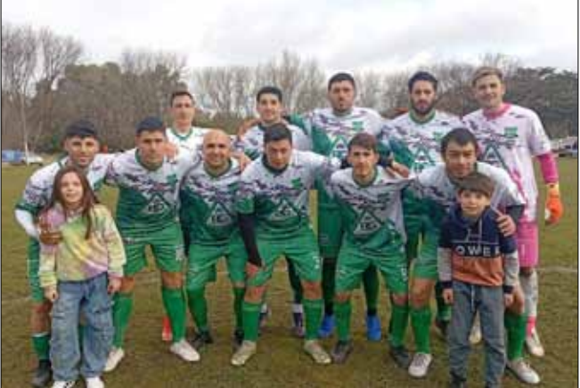
Primera división de Ibarra.

Posiciones acumuladas (primera y segunda rueda) Primera división