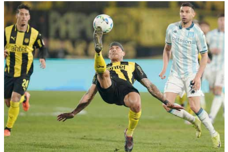
Festejo. Obligado. El equipo de Gustavo Costas debe ganar por dos goles para asegurar la clasificación.

Hoy a las 21.30 el conjunto argentino recibirá al equipo argentino tras la derrota la semana pasada en Montevideo.