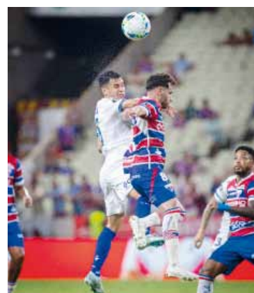
En levantada. El equipo de Liniers viene de ganarle a Independiente.

En esta victoria ante el 'Rojo', el entrenador Barros Schelotto paró un equipo medianamente alternativo en el que solo repitieron titularidad cinco jugadores con