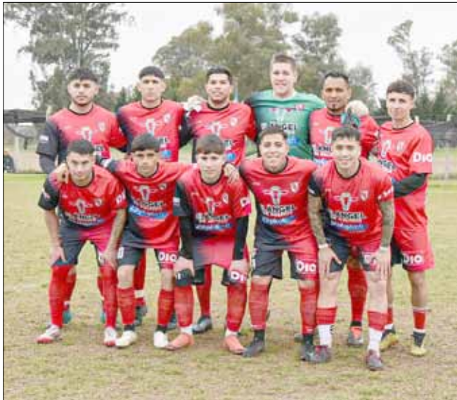
Casariego se presentó en Daireaux y sumó un punto en su empate 3 a 3 con Bancario.

Independiente 1 (Joaquín Ramos) - Bull Dog 1 (Alejo Fernández).