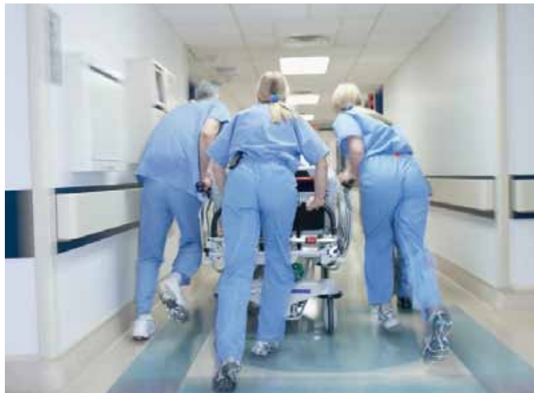
Nuevos. Se trata de los primeros profesionales incorporados al sistema sanitario mediante el Concurso Unificado 2025,

Durante el acto, las y los profesionales que rindieron el examen de ingreso al sistema de residencias seleccionaron, según su orden de mérito y especialidad, la institución donde desempeñarán su formación.